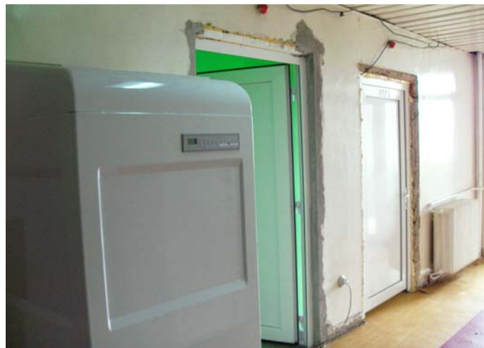
Hopital de Baia Mare