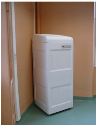
Hopital de Nogent le Rotrou